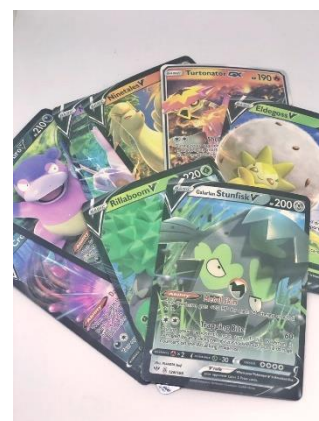
Obrázek 3 - typický obsah falešného balíčku