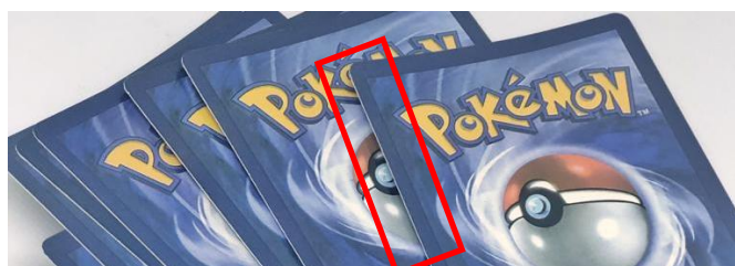
Obrázek 5 - prosvítající karton falešných karet