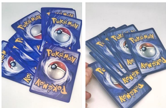
Obrázek 4 - zadní strany falešných karet různých odstínů