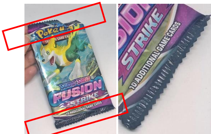
Obrázek 1 - zubatý okraj falešného balíčku