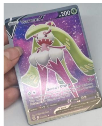
Obrázek 6 - centrování, špatný lesk