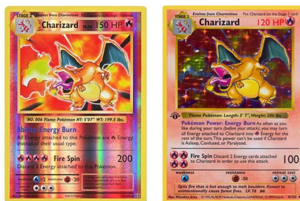
Obrázek 9 - příklad Reverse Holo a Normal Holo karty