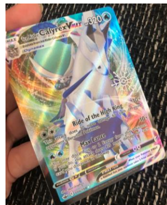
Obrázek 7 - správný lesk