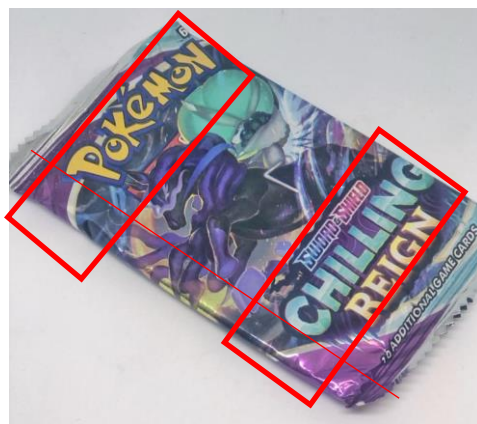
Obrázek 2- grafika není vycentrována